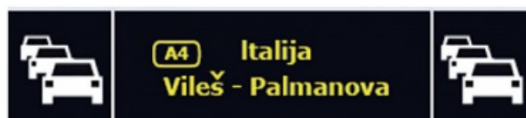
Obrázek 4 – Příklad textu VMS s jedním piktogramem na každé straně