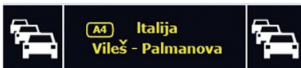
Obrázek 4 – Příklad textu VMS s jedním piktogramem na každé straně