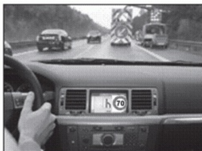
Obrázek 1 – Příklad zobrazení dynamických zpráv ve vozidle (obr. 1 normy)

Tato technická specifikace definuje službu pro posílání a zobrazování informací a dopravního značení z pozemní komunikace do vozidla, a také způsob zobrazení dopravních informací a dopravního značení ve vozidle s ohledem na jeho vnímání řidičem. Dále technická specifikace řeší, jaké informace a s jakou validitou jsou posílány z dopravní infrastruktury do vozidla. Příkladem jsou rychlostní značky, dopravní informace, a zejména pak dynamické zprávy a informace z proměnného dopravního značení a ze zařízení pro provozní informace. Nedílnou součástí technického popisu je i představení vlastní architektury, komunikační protokol a sady požadavků na vhodné úroveň vysílacího výkonu, šifrování komunikace mezi stanicí instalovanou na infrastruktuře, např. dopravní značkou a vozidlem (posílání symbolů dopravních značek či informací), včetně odpovědností operátora za nastavení správné informace pro přenos.