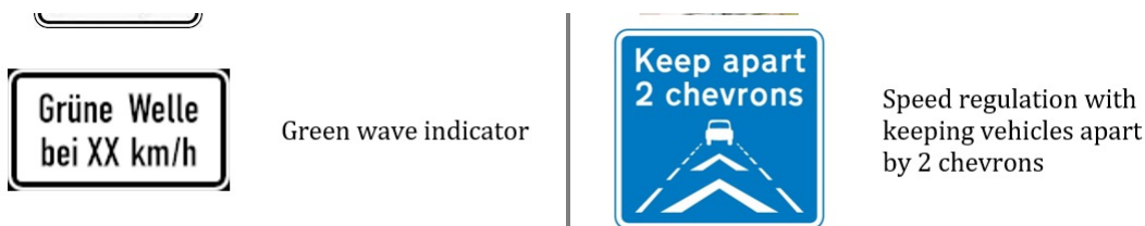
Obrázek 4 - Ukázkou části tabulky s příklady dopravních značek (tabulka C.19 normy)

Tato příloha (rozsah 9 stran) obsahuje 10 obrázků značek omezujících rychlost (i nepřímou, podle rychlosti vozidla vpředu) a jejich krátký popis.