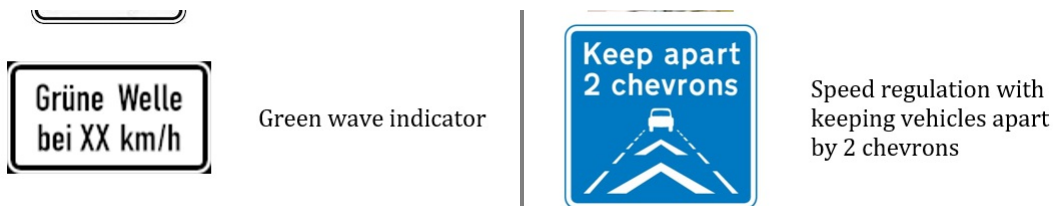
Obrázek 4 - Ukázkou části tabulky s příklady dopravních značek (tabulka C.19 normy)

Tato příloha (rozsah 9 stran) obsahuje 10 obrázků značek omezujících rychlost (i nepřímou, podle rychlosti vozidla vpředu) a jejich krátký popis.