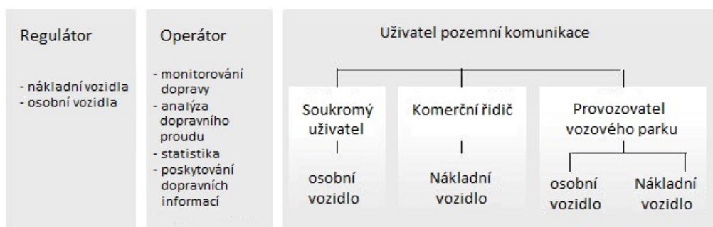
Obrázek 1 – Klasifikace ITS aplikací sídlících v OBE podle typu uživatele (obrázek 2 normy)

Analýza základních EFC norem ISO a CEN ukazuje, že EFC normy mají potenciál být užitečnými platformami pro definování VAS služeb , ale žádný výslovný odkaz na VAS v současné době neexistuje.