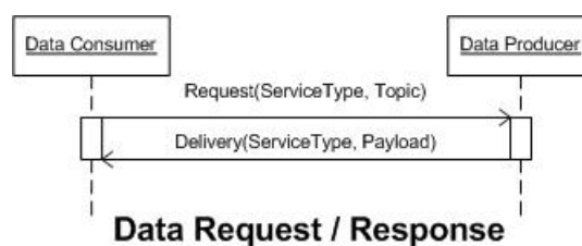
Obrázek 2 – Znázornění jednoduché interakce mezi klientem ( Data Consumer ) a serverem ( Data Producer ) na základě požadavku (Request) na doručení odpovědi (Delivery)

Publish/Subscribe : umožňuje na opakovaná ohlášení distribuovat data o událostech a situacích detekovaných službou v reálném čase. Tento způsob komunikace je znázorněn na obrázku 3.