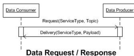
Obrázek 2 – Znázornění jednoduché interakce mezi klientem ( Data Consumer ) a serverem ( Data Producer ) na základě požadavku (Request) na doručení odpovědi (Delivery)

Publish/Subscribe : umožňuje na opakovaná ohlášení distribuovat data o událostech a situacích detekovaných službou v reálném čase. Tento způsob komunikace je znázorněn na obrázku 3.