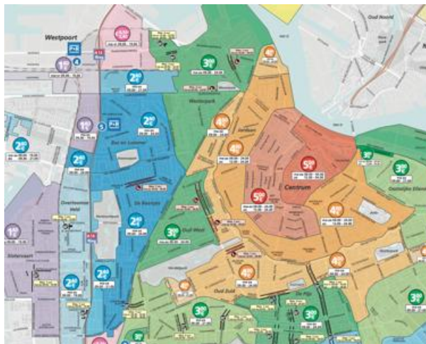
Obrázek 1 — Parkovací zóny v Amsterdamu s jasně definovanými cenami za parkovné pro návštěvníky (obr. 1 v popisovaném dokumentu)

Níže je pro ukázkou uveden obrázek 1 dokumentu, který ilustruje zónové vymezení dopravy v Amsterdamu jako základní krok pro zónovou regulaci a využití geofencingu, jako Krok 2 dané strategie (článek 7.2.3).