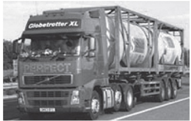
Obrázek 2: Příklady tahače a dvou ISO kontejnerů (dle schématu na obrázku 1 výše) (Obrázek 6 normy)