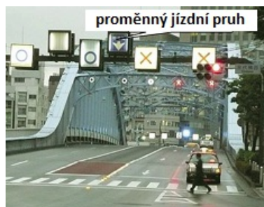
Obrázek 2 — Informace o jízdních pruzích (D.1.3 s přehledem informačních služeb k jízdnímu pruhu )