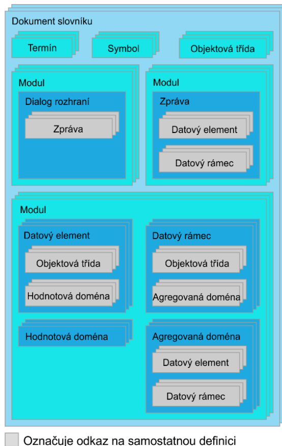
Obrázek 2 — Dokumentace datových konceptů

Tato kapitola o 7 stranách vysvětluje 9 datových konceptů pro potřeby datového registru. Vlastnosti a chování těchto datových konceptů se řídí stejnou sadou pravidel. V rámci ITS mohou existovat datové koncepty, které reprezentují například autobusovou trasu a relevantní informace o ní. Datové koncepty zahrnují slovníkový dokument, modul, třídu objektů, datový prvek, hodnotovou doménu, dialog rozhraní, zprávu, datový rámec a agregovanou doménu.