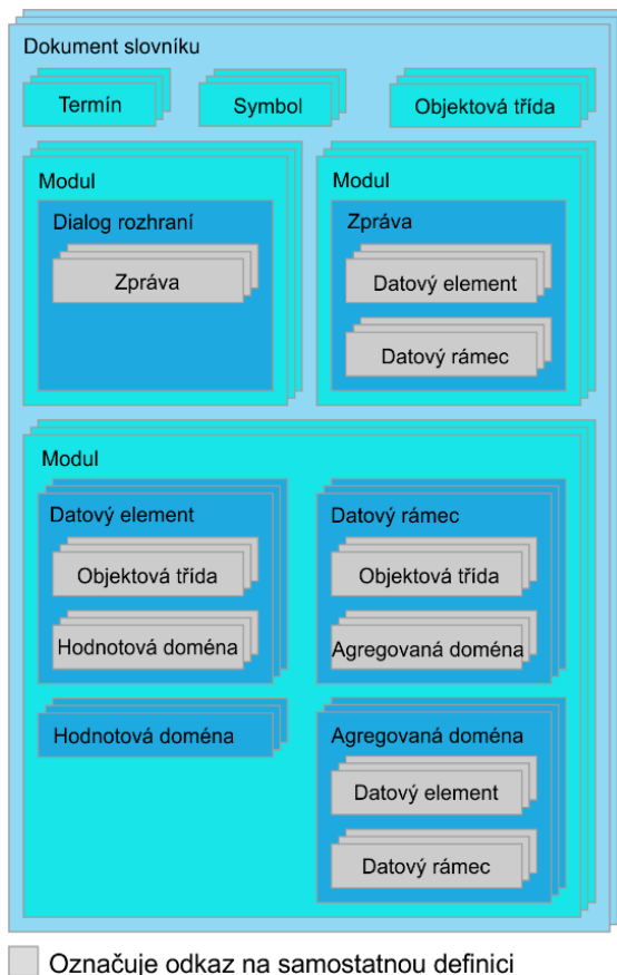
Obrázek 2 — Dokumentace datových konceptů

Tato kapitola o 7 stranách vysvětluje 9 datových konceptů pro potřeby datového registru. Vlastnosti a chování těchto datových konceptů se řídí stejnou sadou pravidel. V rámci ITS mohou existovat datové koncepty, které reprezentují například autobusovou trasu a relevantní informace o ní. Datové koncepty zahrnují slovníkový dokument, modul, třídu objektů, datový prvek, hodnotovou doménu, dialog rozhraní, zprávu, datový rámec a agregovanou doménu.