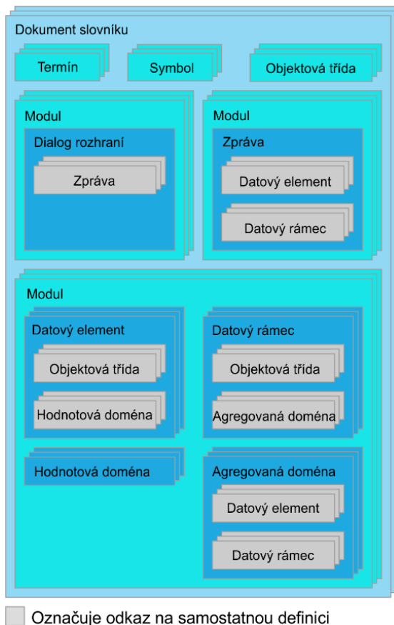
Obrázek 2 — Dokumentace datových konceptů

Tato kapitola o 7 stranách vysvětluje 9 datových konceptů pro potřeby datového registru. Vlastnosti a chování těchto datových konceptů se řídí stejnou sadou pravidel. V rámci ITS mohou existovat datové koncepty, které reprezentují například autobusovou trasu a relevantní informace o ní. Datové koncepty zahrnují slovníkový dokument, modul, třídu objektů, datový prvek, hodnotovou doménu, dialog rozhraní, zprávu, datový rámec a agregovanou doménu.