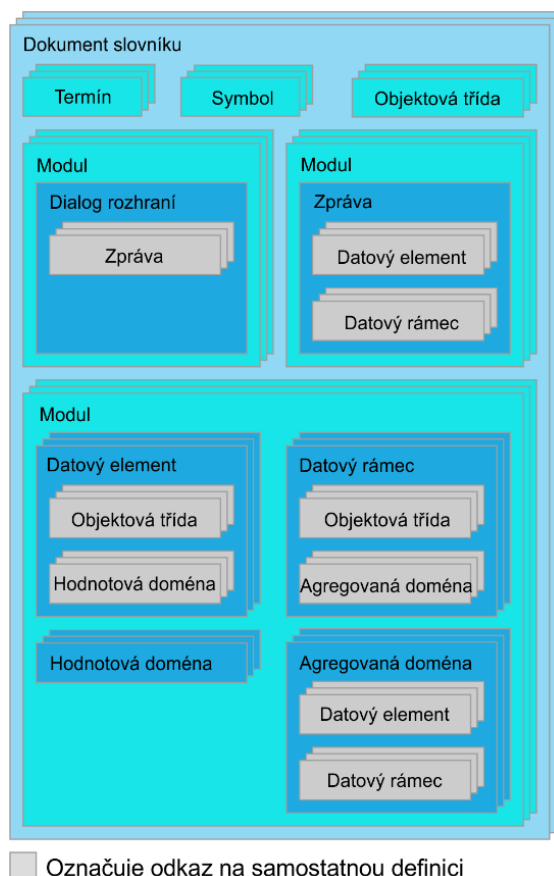
Obrázek 2 — Dokumentace datových konceptů

Tato kapitola o 7 stranách vysvětluje 9 datových konceptů pro potřeby datového registru. Vlastnosti a chování těchto datových konceptů se řídí stejnou sadou pravidel. V rámci ITS mohou existovat datové koncepty, které reprezentují například autobusovou trasu a relevantní informace o ní. Datové koncepty zahrnují slovníkový dokument, modul, třídu objektů, datový prvek, hodnotovou doménu, dialog rozhraní, zprávu, datový rámec a agregovanou doménu.