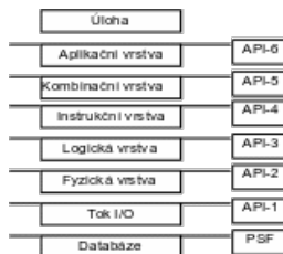
Obrázek 4 - Úrovně API

Problém s umístěním API v příliš spodní úrovni ( úroveň API 2 a nižší) je ten, že zde není žádná výhoda z důvodu extrémně nízké úrovně společného rozhraní. Přinejmenším by ISO- API mělo oddělovat aplikační software od PSF a medií, a kromě toho by nemělo být závislé na dané HW konfiguraci.