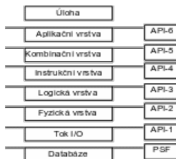
Obrázek 4 - Úrovně API

Problém s umístěním API v příliš spodní úrovni ( úroveň API 2 a nižší) je ten, že zde není žádná výhoda z důvodu extrémně nízké úrovně společného rozhraní. Přinejmenším by ISO- API mělo oddělovat aplikační software od PSF a medií, a kromě toho by nemělo být závislé na dané HW konfiguraci.