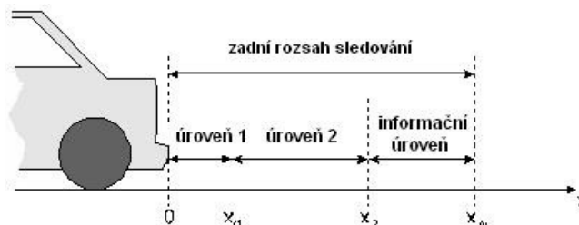
Obrázek 3 – Úrovně varování pro zadní sledovanou oblast