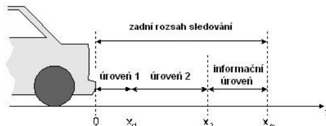
Obrázek 3 – Úrovně varování pro zadní sledovanou oblast