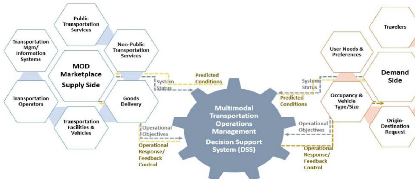
Obrázek 3 – Strana nabídky a poptávky po dopravě v konceptu MOD

Článek 5.3 podává stručnější popis amerického modelu, který nejlépe vyjadřuje obrázek 3.