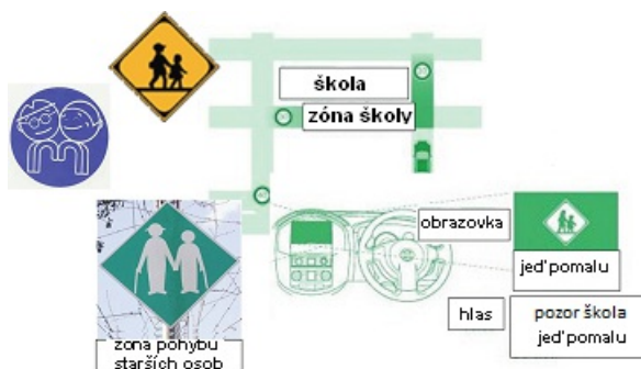
Obrázek 3 — Informace o dopravní zóně (D.1.7 s nabídkou silničních informací)

System může nabízet řidiči informace o momentálním využití místní pozemní komunikace, například o rozdělení pozemní komunikace na část využívanou chodci a část využívanou vozidly, za účelem zvýšení bezpečnosti žáků a dětí při cestě do školy.