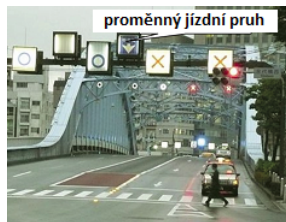
Obrázek 2 – Informace o jízdních pruzích (D.1.3 s přehledem informačních služeb k jízdnímu pruhu)

Příkladem je zprostředkování informací o pozemní komunikaci s jízdním pruhem pro proměnný směr jízdy vozidel, který je navržen za účelem zmírnění kongesce.