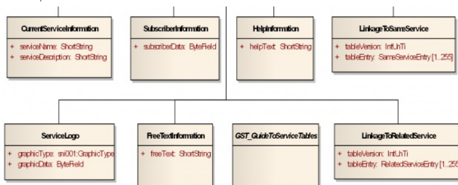
Obrázek 2 – Obecné třídy SNI stanovené v kapitole 8 dokumentu (výřez obr. 6 dokumentu)

Články 8.2 až 8.6 stanovují atributy (rozsahy, typy, příklady) obecných tříd (viz následující obrázek) vyskytujících se v SNI, tak jak byly tyto třídy ukázány na obrázku v kapitole 7.